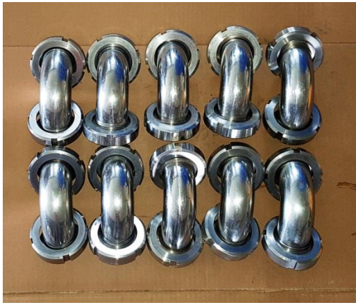
10 Stück 90°-Bogen für Modulköpfe