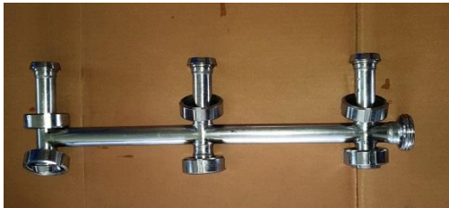
Filtratabgänge für SX6