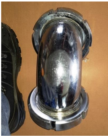
90°-Bogen für SX