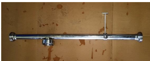
Filtratabgänge für SX