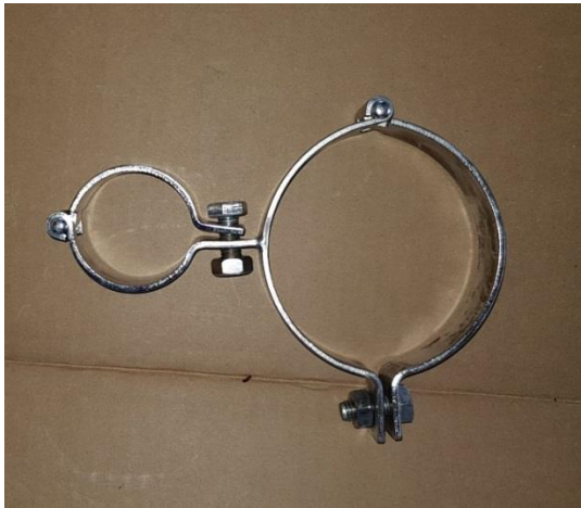
Halterung für Wasserfilter