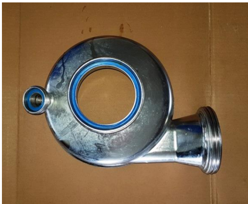
Pumpengehäuse für SX8