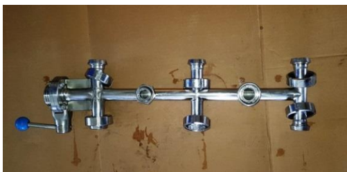
Filtratabgänge für SX6